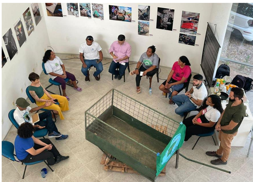
Figura 6: Roda de conversa com os profissionais de catação durante a exposição “Catadores”