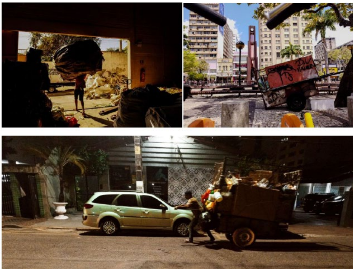
Figura 3 a 5 - Fotografias da exposição retratando o ambiente da associação e da paisagem urbana.