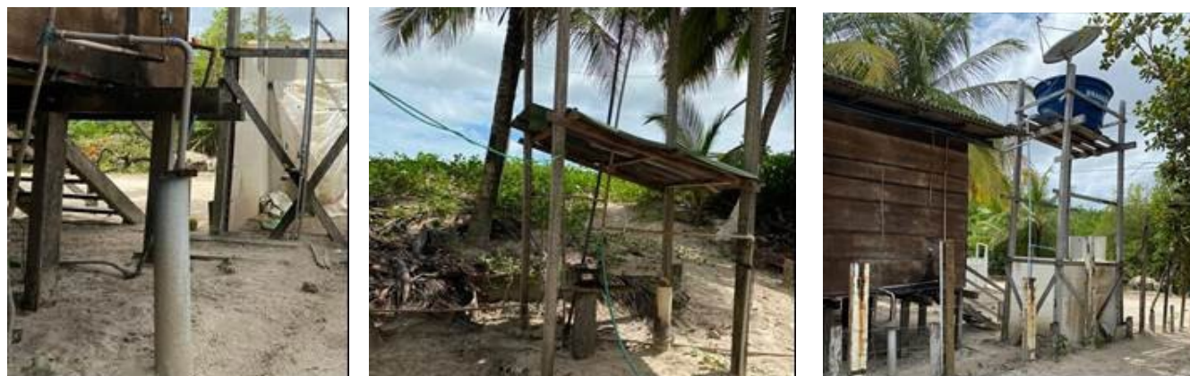
Figura 2 – Poços artesianos, bombas e armazenamento em caixas d'água de mil litros, na comunidade pesqueira Olho de Porco, Paço do Lumiar, MA, Brasil.

Os moradores entrevistados, consideram estes poços privados como sendo “comunitários”, pois conseguem atender suas necessidades prioritárias e básicas de água, como: consumo humano, higiene, lavagem de roupas, limpeza das casas e outros. Foi comum observar, que mesmo tendo acesso ao recurso, sentem-se esquecidos pelos órgãos que deveriam garantir este tipo de atendimento. E mencionam que as atividades diárias poderiam ser melhor executadas, caso existisse um sistema seguro e eficiente para o atendimento das demandas.