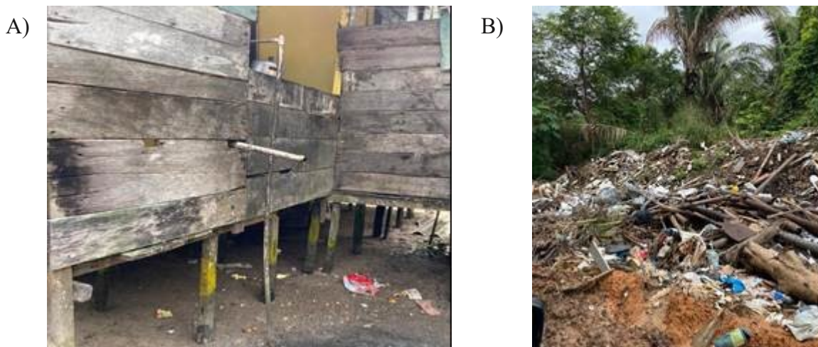
Figura 4 – a) esgoto de uma residência sendo lançado diretamente no solo; e b) resíduos sólidos dispostos à margem, da comunidade pesqueira da praia Olho de Porco, Paço do Lumiar, MA, Brasil.